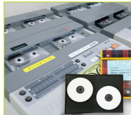
機関誌の音訳・発送